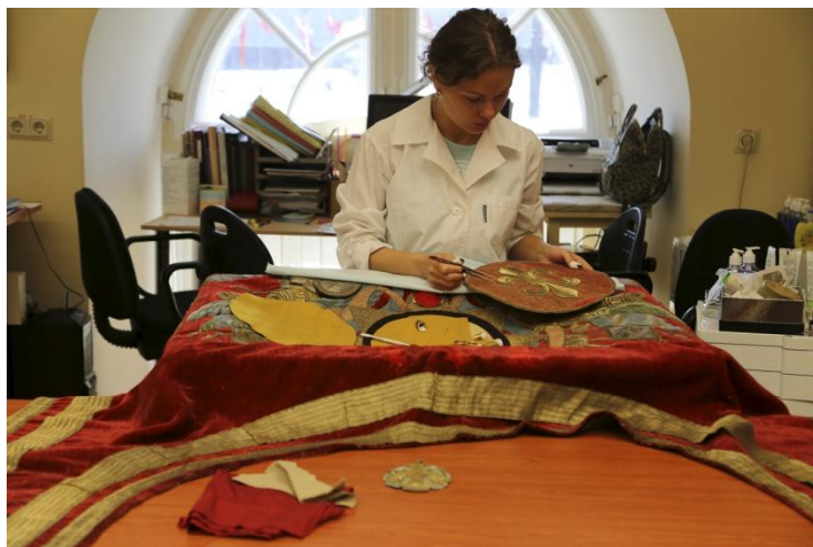
Hermitage San Pietroburgo 2019