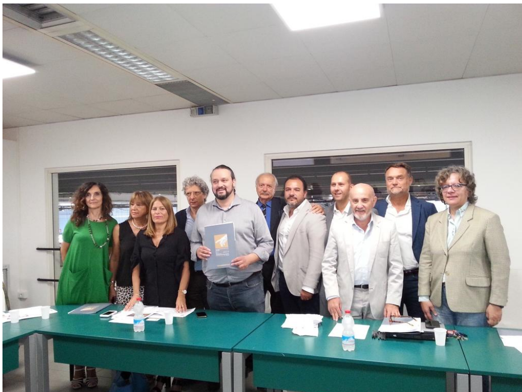
Conferenza stampa XXVI Salone del Restauro

Un contenitore di eventi: stand - espositori - convegni - mostre collaterali - imprese d'eccellenza - personaggi di rilievo nazionale ed internazionale.